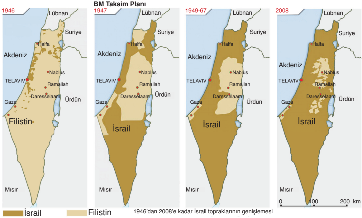
Harita 6.4 Filistin'in işgal süreci

BM, AB, ABD ve Rusya Federasyonu tarafından Nisan 2002'de, bölgede huzur ve güven için de yan yana yaşayacak iki devletin kurulması amacıyla "Yol Haritası" adı altında yeni bir çözüm planı oluşturulmuşsa da sorununa kalıcı bir çözüm getirilememiş, egemen bir Filistin Devleti'nin kurulmasını sağlayamamıştır. 2009 yılında İsrail tarafından gerçekleştirilen Gazze saldırısı yüzlerce Filistinlinin ölümüne, binlercesinin evsiz kalmasına yol açmıştır. İsrail'in Gazze'de orantısız güç kullanarak savaş suçu işlediğini belirten Goldstone Raporu, BM Genel Kurulunda kabul edilmiştir.