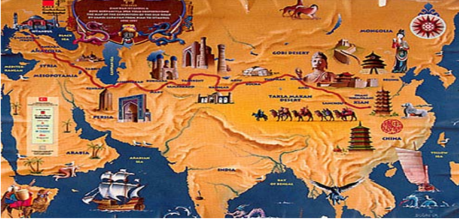
İpek Yolu Haritası

Coğrafi keşiflerle yeni yollar bulununca Baharat Yolu önemini yitirdi.