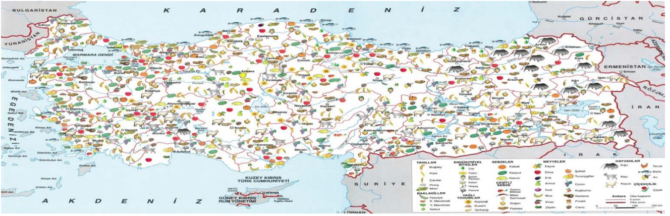
Türkiye Tarım ve Hayvancılık Dağılışı Haritası