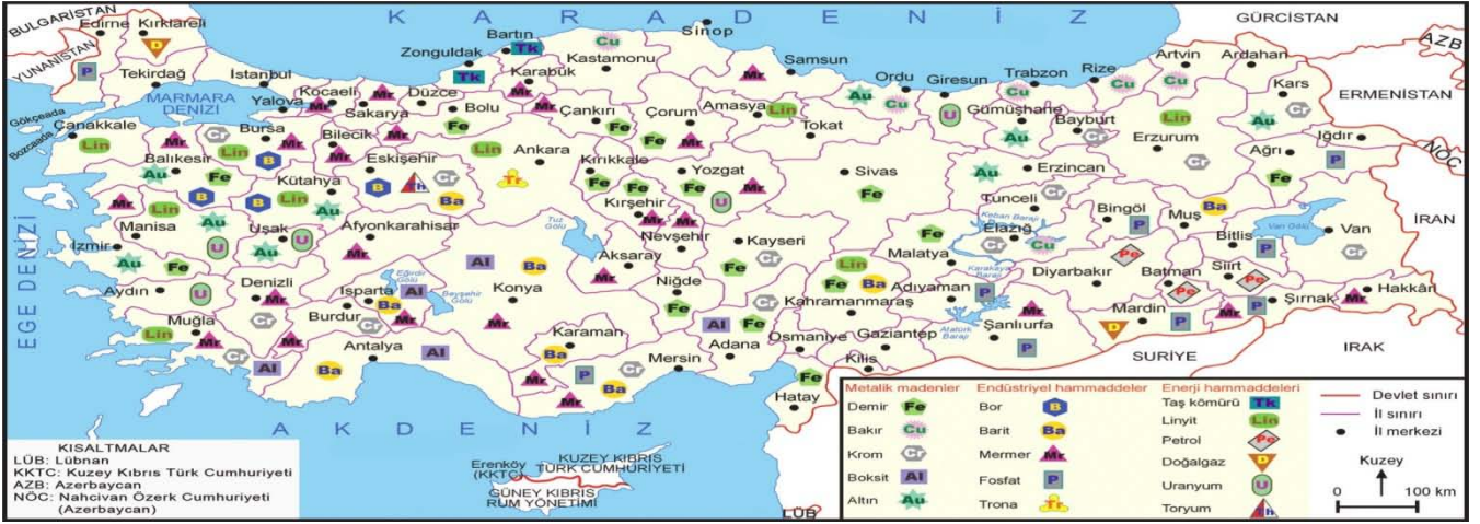
Türkiye Maden Dağılışı Haritası

BİLGİ NOTU: Meriç ve Asi Nehirleri ülke sınırlarımızın dışından gelip ülkemizden geçerek çevremizdeki denizlere dökülür.