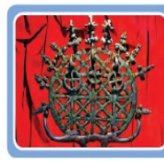
Hititlere ait güneş kursu