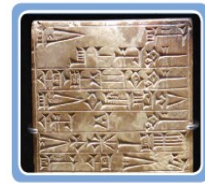
Sümerlere ait yazılı tablet