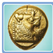
Lidyalılardan kalma para