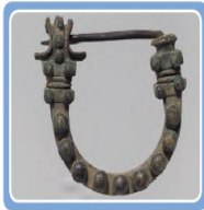
Friglere ait Fibula