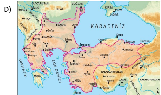
II. Murat Dönemi

İstanbul'un Fethi'nin üçüncü gününde Fatih, kazanmış olduğu zafer nedeniyle büyük törenler ve bayramlar tertipledi. O zamana kadar şehrin muhtelif yerlerinde saklı bulunan büyük küçük herkesin, en ufak bir rahatsızlığa uğramadan serbestçe dolaşmalarını emretti. Savaş korkusu ile şehirden kaçmış olanların evlerine dönmelerini ve herkesin, önceden olduğu gibi evinde kendi örf ve âdetleriyle dinine uygun olarak yaşamasını buyurdu (Özdemir, 1999, s.223-226).