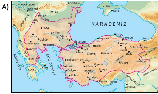
Yıldırım Bayezid Dönemi

Yukarıda bahsedilen gelişmelerin gösterildiği harita hangi seçenekte doğru olarak verilmiştir?