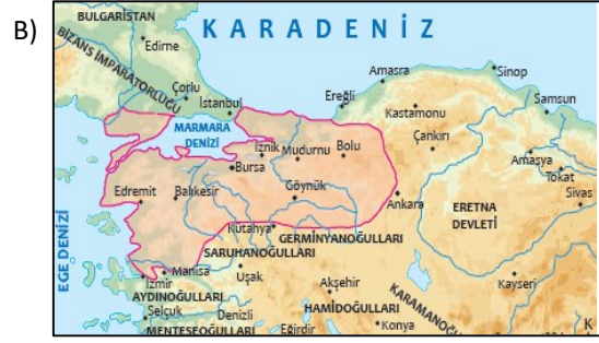
Orhan Gazi Dönemi