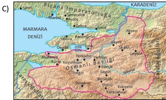
Osman Gazi Dönemi