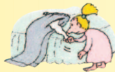
la poche, le mouchoir