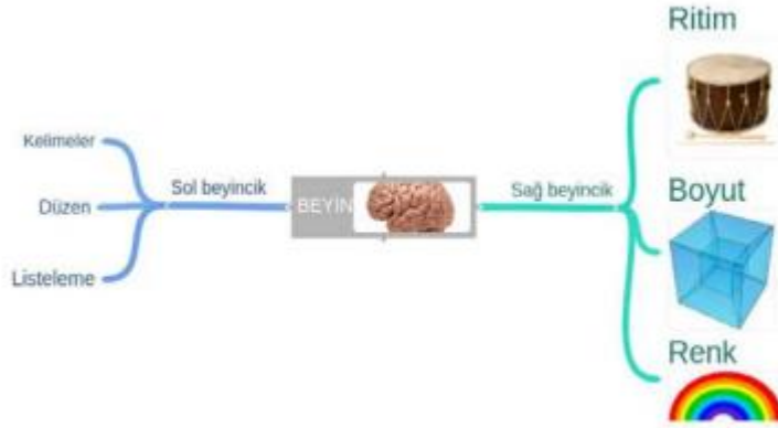
Şekil 2. Örnek bir zihin haritası (Şen, 2017)