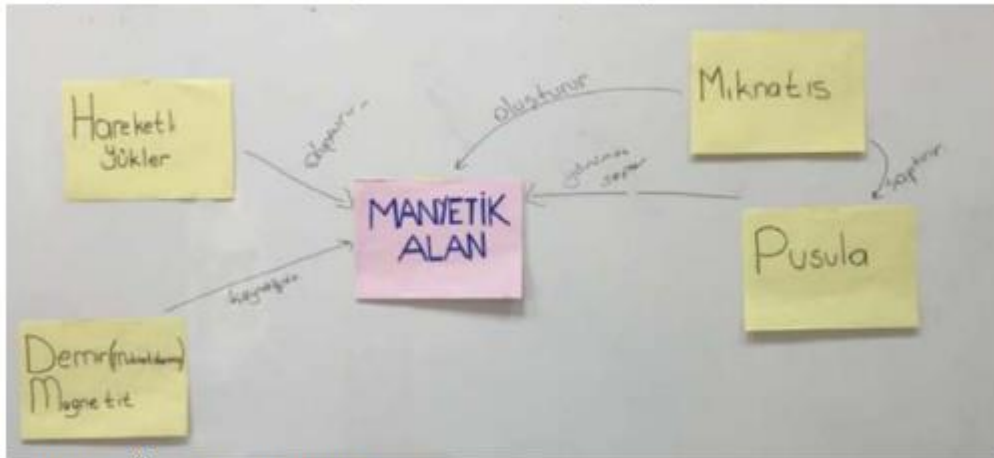
Şekil 1. Örnek bir kavram haritası

Tipik bir kavram haritası Şekil 1'de verilmiştir (Şen 2017).