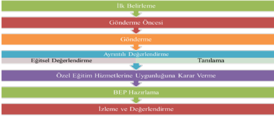
Şekil 1. Değerlendirme Süreci